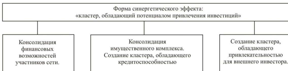
Рис. 3. Процесс формирования синергетического эффекта промышленно-интегрированной структуры в форме «формирование кластера, обладающего потенциалом привлечения инвестиций»

Наглядно процесс получения синергетического эффекта в форме кластера, обладающего потенциалом привлечения инвестиций, представлен на рисунке 3.