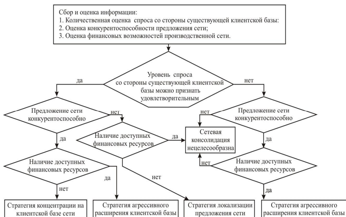
Рис. 4. Описание процесса выбора стратегической целевой установки проектируемой промышленно-интегрированной структуры