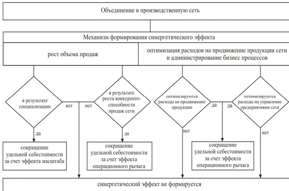
Рис. 1. Процесс формирования синергетического эффекта промышленно-интегрированной структуры в форме «оптимизация текущих расходов»

2. Рост конкурентоспособности предложения. Изменение конкурентоспособности консолидированного предложения предприятий интегрированных структур может быть обеспечено за счёт роста рейтингов критериев сравнения. Рассматривая привлекательность предложения в структуре критериального профиля модели 4P, можно сформулировать следующий комплекс выводов: рост рейтинга привлекательности предложения по критерию «распространение» может быть обеспечен повышением эффективности сбытовой инфраструктуры, вызванной объединением. Увеличение интенсивности производства, консолидация производственного потенциала, а также возможность внутренней специализации, позволит повысить